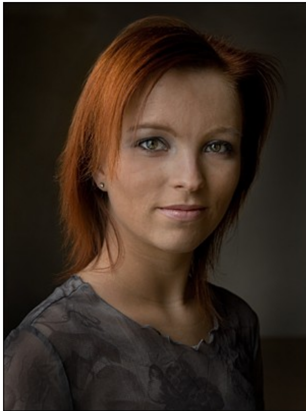
Klassisk 3:4 format - 4 højt og 3 bred.

Da Leica i første halvdel af forrige århundrede lancerede 35mm formatet, var det således noget af en nytænkning. Det nye format, 24 x 36, var jo i forholdet 2:3 og det har i alle årene siden været årsag til mange diskussioner og, ikke mindst, en hel del spekulationer om beskæring i mørkekammeret. Formatet 13 x 18 blev hurtigt til 12 x 18, og når man skulle overholde det populære 18 x 24, på grund af de færdigkøbte rammer, måtte 35mm fotografene beskære portrætterne en anelse i top og bund.