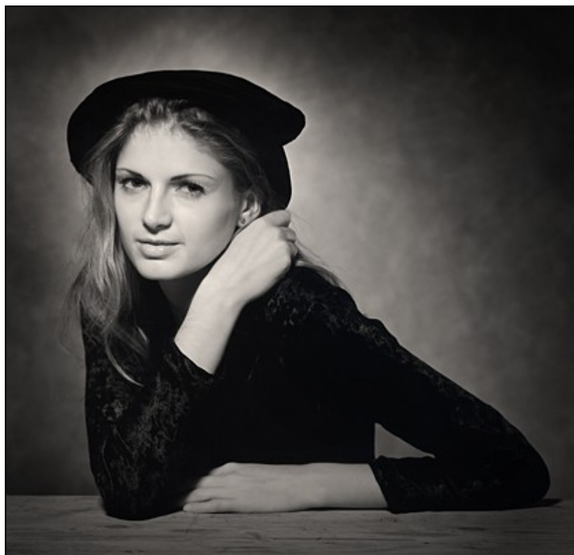
Portræt komponeret i kvadratisk format med Hasselblad kamera.